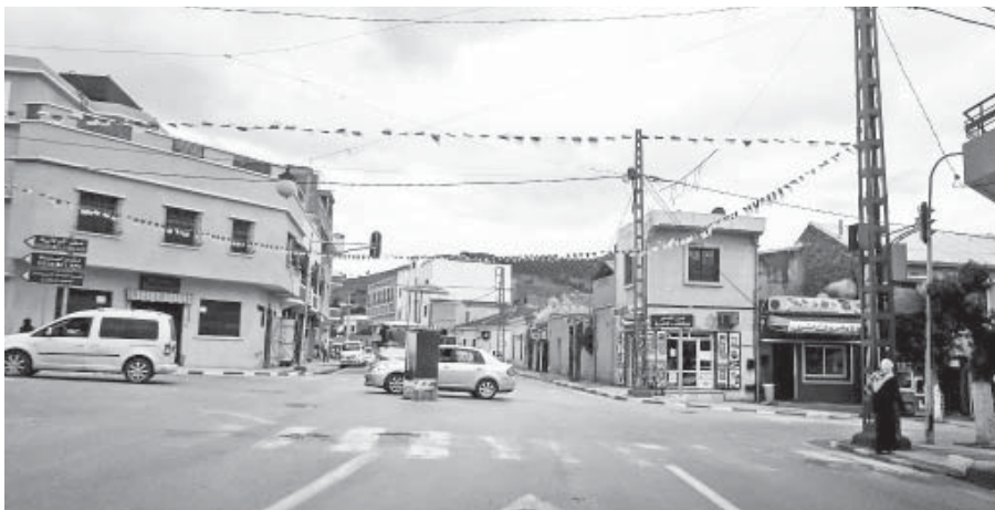
APC de Saïda