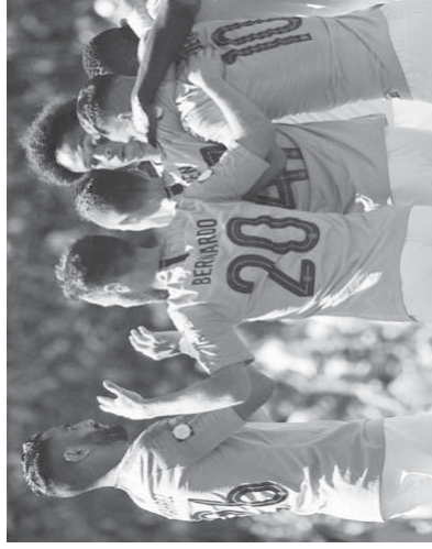
bon match et qu'il mérite largement leur premier trophée de la saison. « Nous avons fait un très bon match aujourd'hui, et le titre est mérité ».