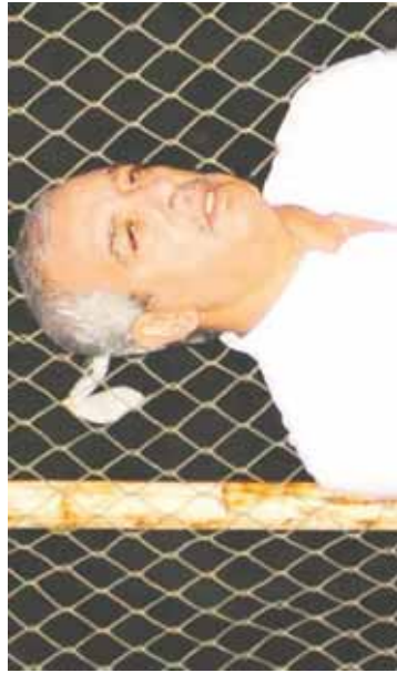
Cheikh Salman bin Ibrahim Al Khalifa (49 ans), les quatre autres candidats admis à se présenter à l'élection à la présidence de la Fifa le 26 février, pour succéder à Sepp Blatter, démissionnaire depuis le 2 juin et suspendu huit ans, sont le Prince Ali bin Jordanie, le Sud-africain Tokyo Sexwale, le secrétaire général de l'UEFA Gianni Infantino et l'ancien secrétaire général adjoint de la Fifa Jérôme Champagne.

Le candidat à la présidence de la Fifa Cheikh Salman a lancé sa plateforme de campagne jeudi avec pour proposition phare une séparation de la Fifa en deux entités, l'une chargée de gérer le foot, l'autre l'aspect financier du sport. Pour l'occasion, le président de la Confédération asiatique (AFC), la Fifa football aurait pour ses compétitions internationales portant le label Fifa four-nous (Coupe du monde de Coupe du monde des clubs, etc.). La "Fifa business" serait elle chargée de toutes les questions de financement, de marketing, de droits télé, etc. "C'est uniquement en séparant strictement l'origine des fonds et en supervisant chaque dépense que nous pourrions garantir la renaissance d'une nouvelle Fifa qui rende réellement des comptes et qui soit digne du respect de chacun", a affirmé Cheikh Salman, dans un communiqué annonçant le lancement de cette plateforme et d'un site internet dédié, www.shahksalman.org. Outre le Bahreïni Salman bin Ibrahim Al Khalifa (49 ans), les quatre autres candidats admis à se présenter à l'élection à la présidence de la Fifa le 26 février, pour succéder à Sepp Blatter, démissionnaire depuis le 2 juin et suspendu huit ans, sont le Prince Ali bin Jordanie, le Sud-africain Tokyo Sexwale, le secrétaire général de l'UEFA Gianni Infantino et l'ancien secrétaire général adjoint de la Fifa Jérôme Champagne.