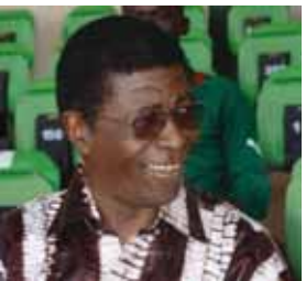
"l'éclosion" de la génération actuelle formant l'équipe nationale du Burkina Faso. 70% de l'effectif actuel des Etats-Unis est formé de joueurs qui avaient commencé leur carrière internationale sous ma coupe.

"Notre équipe évolue mieux à l'étranger. Elle l'a prouvé d'ailleurs à maintes reprises. Je suis persuadé qu'elle le prouvera encore en Algérie, profitant de la pression qui sera énorme sur l'adversaire lors du match retour", a-t-il ajouté. Ayant entraîné la sélection des Etats-Unis en 2006, le "Saboteur" s'est dit "fier" d'avoir été derrière