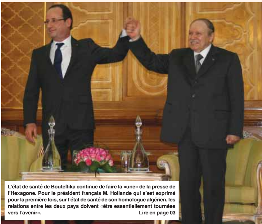
L'état de santé de Bouteflika continue de faire la «une» de la presse de l'Hexagone. Pour le président français M. Hollande qui s'est exprimé pour la première fois, sur l'état de santé de son homologue algérien, les relations entre les deux pays doivent «être essentiellement tournées vers l'avenir».