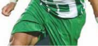
ESM 2 - OM 1